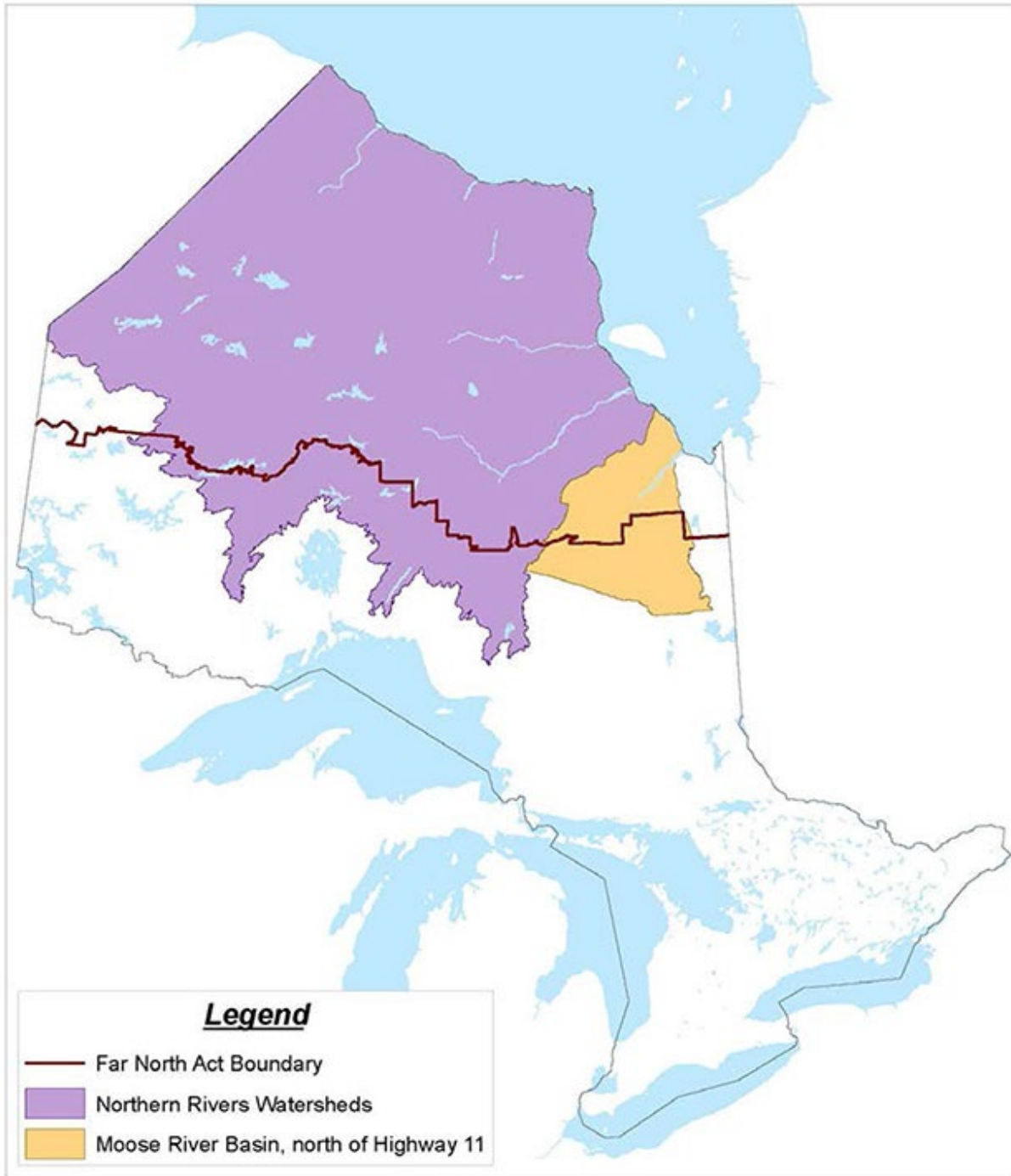
Figure 1 – Zones visées par la présente politique concernant les énergies renouvelables sur les terres publiques